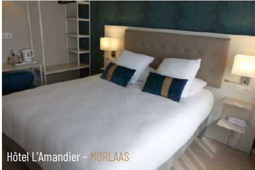
Hôtel L'Amandier - MORLAAS