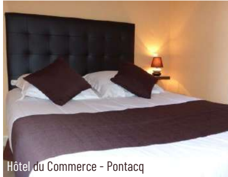
Hôtel du Commerce - Pontacq