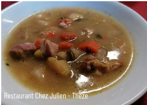
Restaurant Chez Julien - Theze