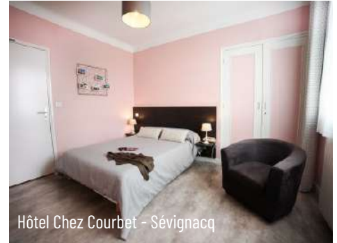
Hôtel Chez Courbet - Sévignacq