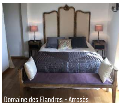
Domaine des Flandres - Arrosès