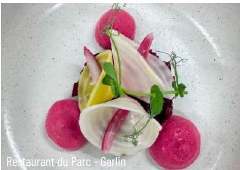
Restaurant du Parc - Garlin

Quelques restaurants proposent des plats bistro-miques.