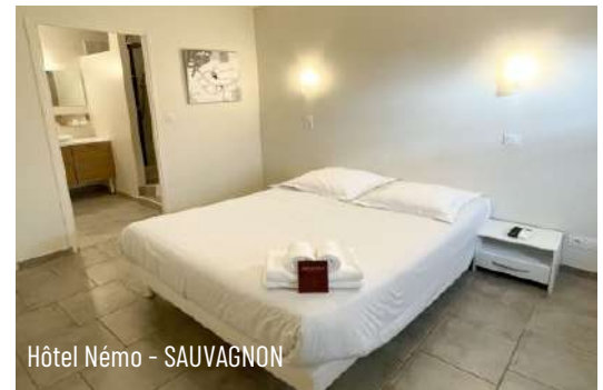
Hôtel Nêmo - SAUVAGNON