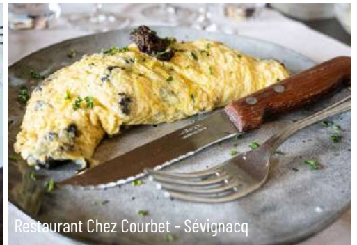
Restaurant Chez Courbet - Sévignacq