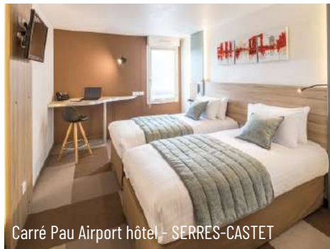
Carré Pau Airport hôtel - SERRES-CASTET