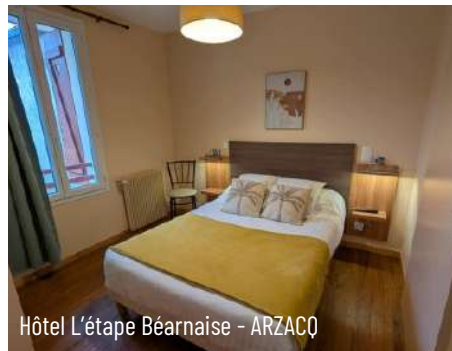
Hôtel L'étape Béarnaise - ARZACQ