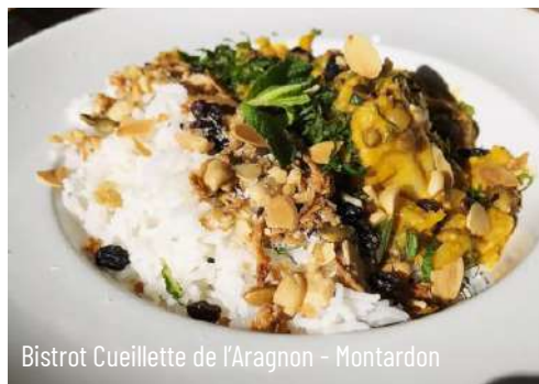
Bistrot Cueillette de l'Aragon - Montardon