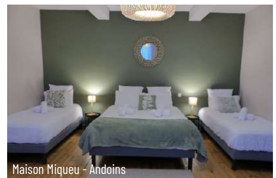
Maison Miqueu - Andoins