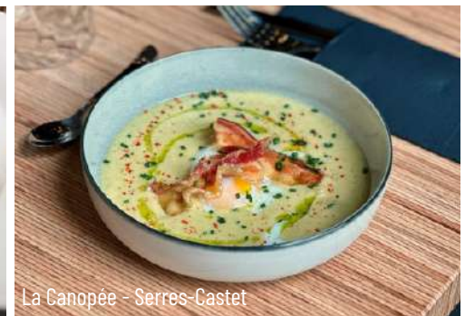
La Canopée - Serres-Castet

Les restaurateurs seront ravis de vous proposer des menus qui répondront à vos attentes.